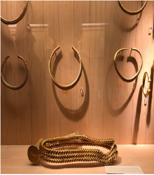
Dans une des nombreuses vitrines des parures en or datant de l'âge de bronze (vers - 1200 ans)

L'heure du rendez-vous au restaurant étant arrivée, nous nous dirigeons vers le "Café Jules" où un excellent repas nous est servi.