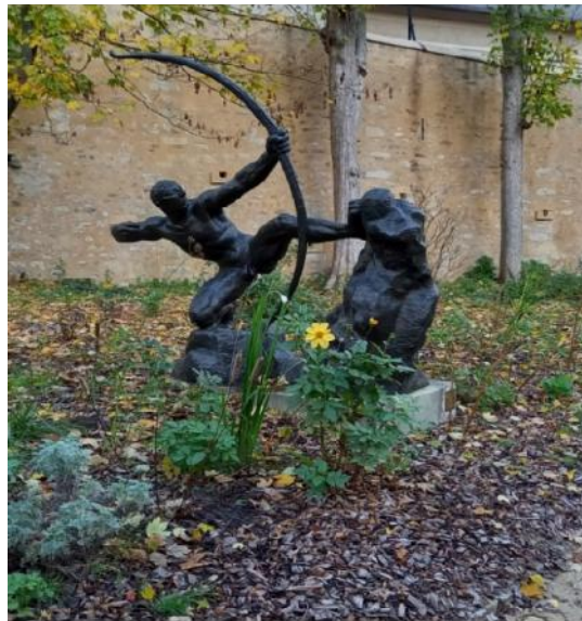
Héraklès archer, I des chef-d'œuvre d'Antoine Bourdelle.

30 Nous retrouvons le car qui nous attend devant le château pour un retour à Nogent à 19 h Encore une bien belle journée avec l'UTL !