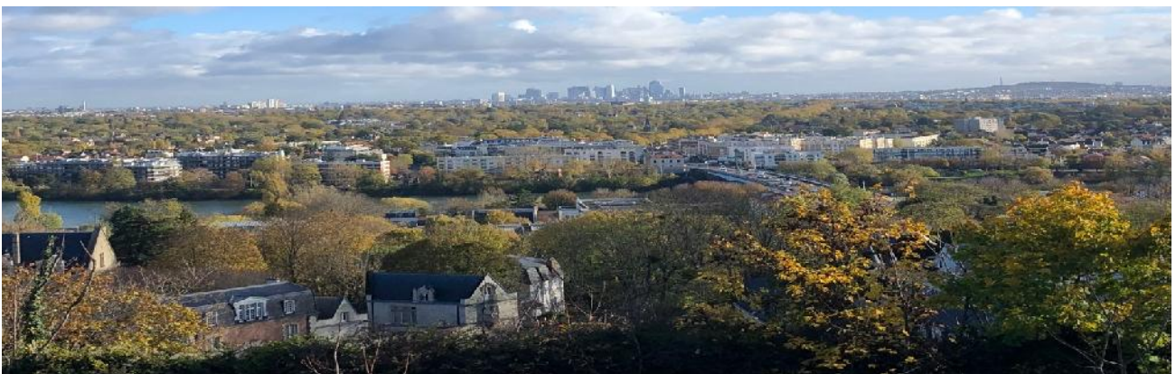
Panorama sur l'Ouest Parisien vu de la Grande Terrasse d'André Le Nôtre

La météo peu clémente et les travaux en cours ne nous ont pas permis d'admirer pleinement les jardins à la française dessinés par Le Nôtre pour Louis XIV, ni de flâner dans le jardin anglais créé au XIX e siècle. Pour clore cette matinée, nous sommes allés jusqu'à la Grande Terrasse d'André Le Nôtre qui offre un superbe panorama sur l'ouest parisien.