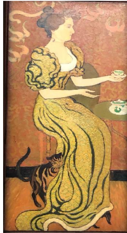
Cette peinture japonisante avec des arabesques raffinées suggère l'élégance de la silhouette et donne à l'œuvre un caractère très décoratif

Tout au long de la visite, nous avons déambulé dans un lieu harmonieux, cadre de vie familiale, comportant une très belle chapelle, des grandes salles éclairées par de hautes fenêtres dominant un jardin orné de sculptures d'un des plus grands sculpteurs du XXe siècle, Antoine Bourdelle, ami intime de Maurice Denis