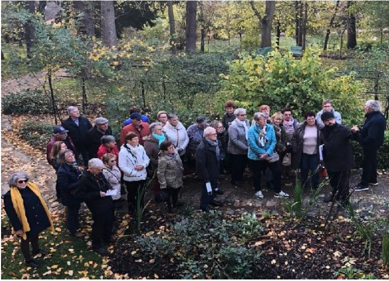
Dans les jardins du musée