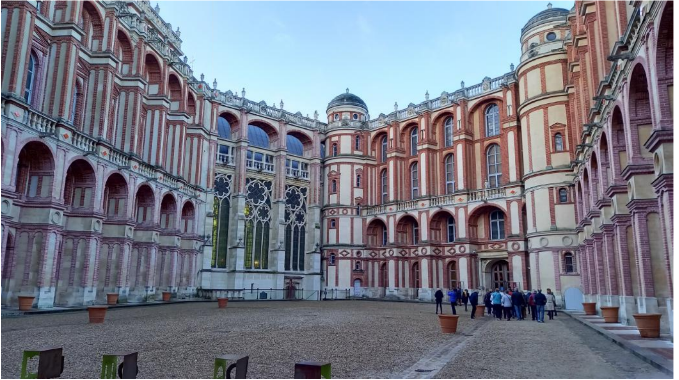
La cour intérieure du château avec sa remarquable chapelle gothique.