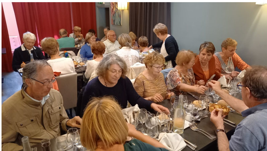
Figure 6 Tous bien installés. De l'avis de chacun, la qualité était présente. Bon moment

C'est l'heure du déjeuner. Dans le vieux Laval, le restaurant « Le Petit Périgord », nous accueille.