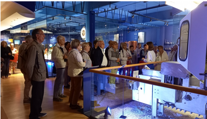
Figure 4 Notre petit groupe à l'écoute du guide

La visite du centre historique de Laval : Un guide de l'office du tourisme nous fait pénétrer la vieille ville. Ici, c'est avec plaisir que nous découvrons et admirons les belles maisons à pans de bois.