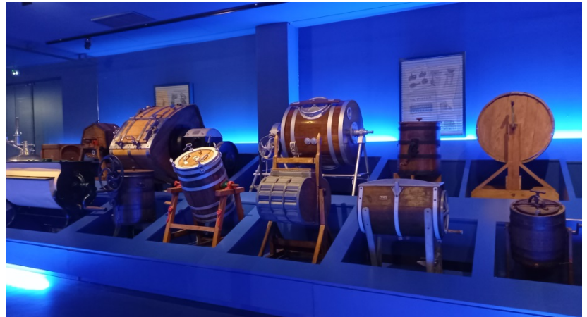
Figure 3 Les barattes

Les commentaires de notre guide, devant la grande diversité des expositions, nous permettent de découvrir l'évolution des métiers du lait.