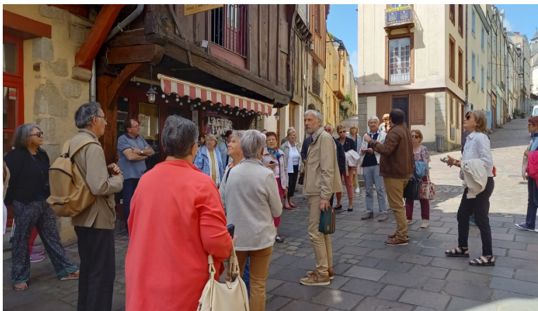
Figure 5 Le centre historique de Laval. Maisons à pans de bois

La visite du centre historique de Laval : Un guide de l'office du tourisme nous fait pénétrer la vieille ville. Ici, c'est avec plaisir que nous découvrons et admirons les belles maisons à pans de bois.