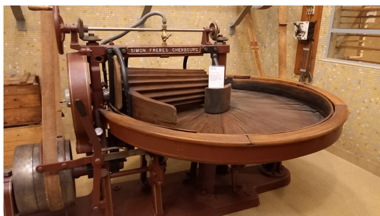
Figure 2 Un malaxeur