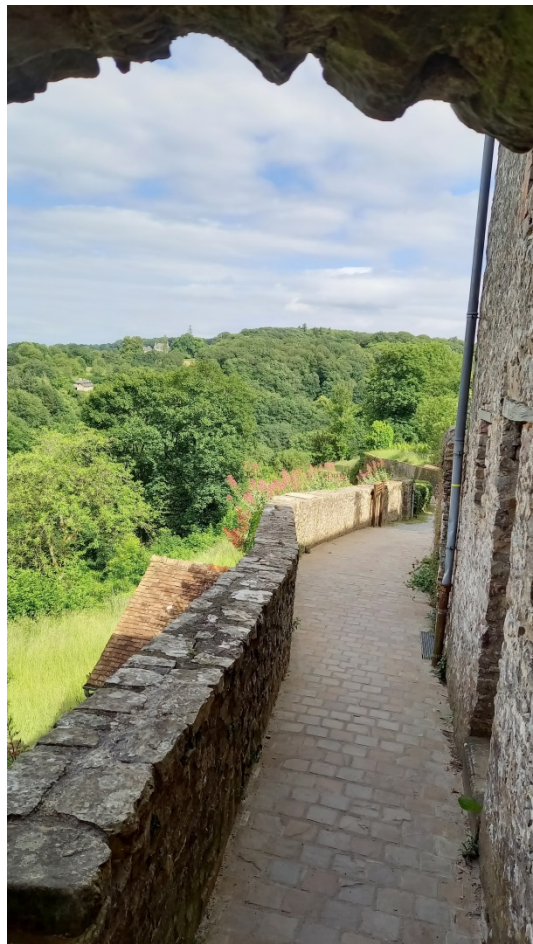
Figure 10 Le chemin autour des remparts

La visite se termina par le suivi du chemin des remparts. Parcours très agréable parsemé de magnifiques vues.