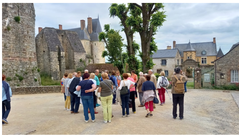
Figure 8 A gauche, tour du château, à l'arrière-plan le logis du château du 17 ème