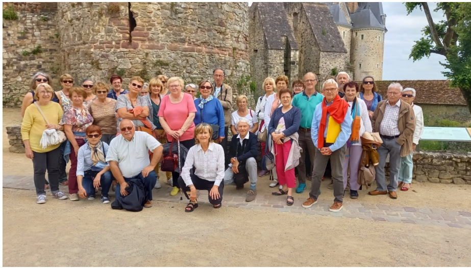
Figure 9 La photo de groupe sympa