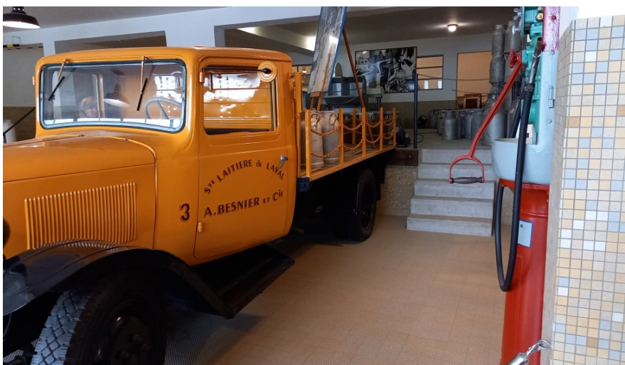
Figure 1 L'ancien quai de réception avec un camion de ramassage du lait des années 50

La visite se divise en 2 parties. D'abord revivre la vie de l'ancienne laiterie dans ses bâtiments d'origine avec le matériel de l'époque puis découvrir un musée moderne consacré à l'histoire des métiers du lait.