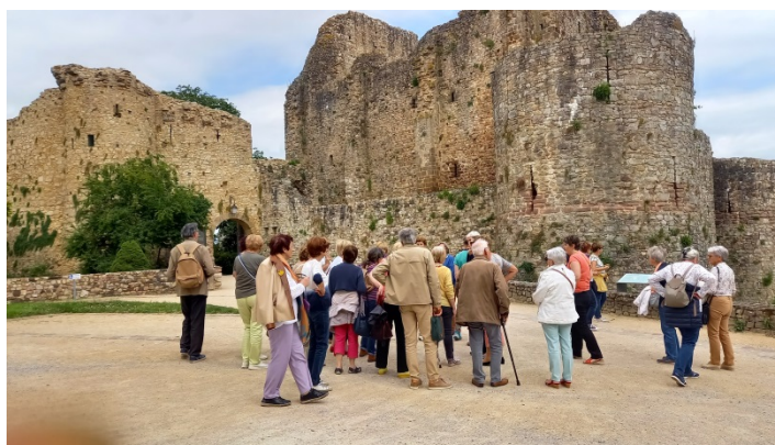
Figure 7 Le donjon du château

Vestige du donjon du début du 11 ème C'est la seule place forte qui résista à Guillaume le Conquérant. Il rappelle celui de Nogent de même époque.