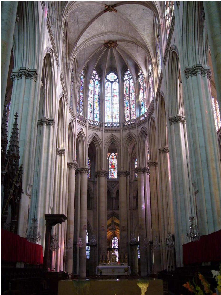
La nef de la Cathédrale

Nous avons poursuivi notre balade à pied accompagnés par des guides qui nous ont fait découvrir la Cathédrale Saint Julien. : son architecture cumule deux arts majeurs, l'art roman pour la nef et l'art gothique pour le chœur et le transept. Elle est un témoignage médiéval du style architectural du gothique angevin.