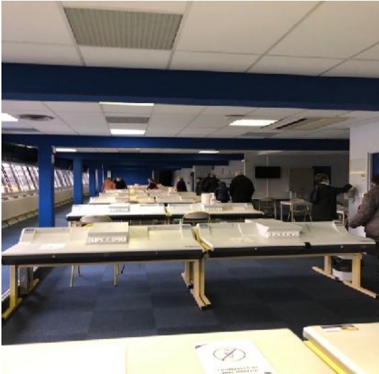
La salle de presse

médias venus du monde entier, celle de la direction des courses et son mur d'écrans véritable centre de contrôle des compétitions, le podium où sont remis les trophées des vainqueurs, tous ces endroits privilégiés où le public n'accède pas.