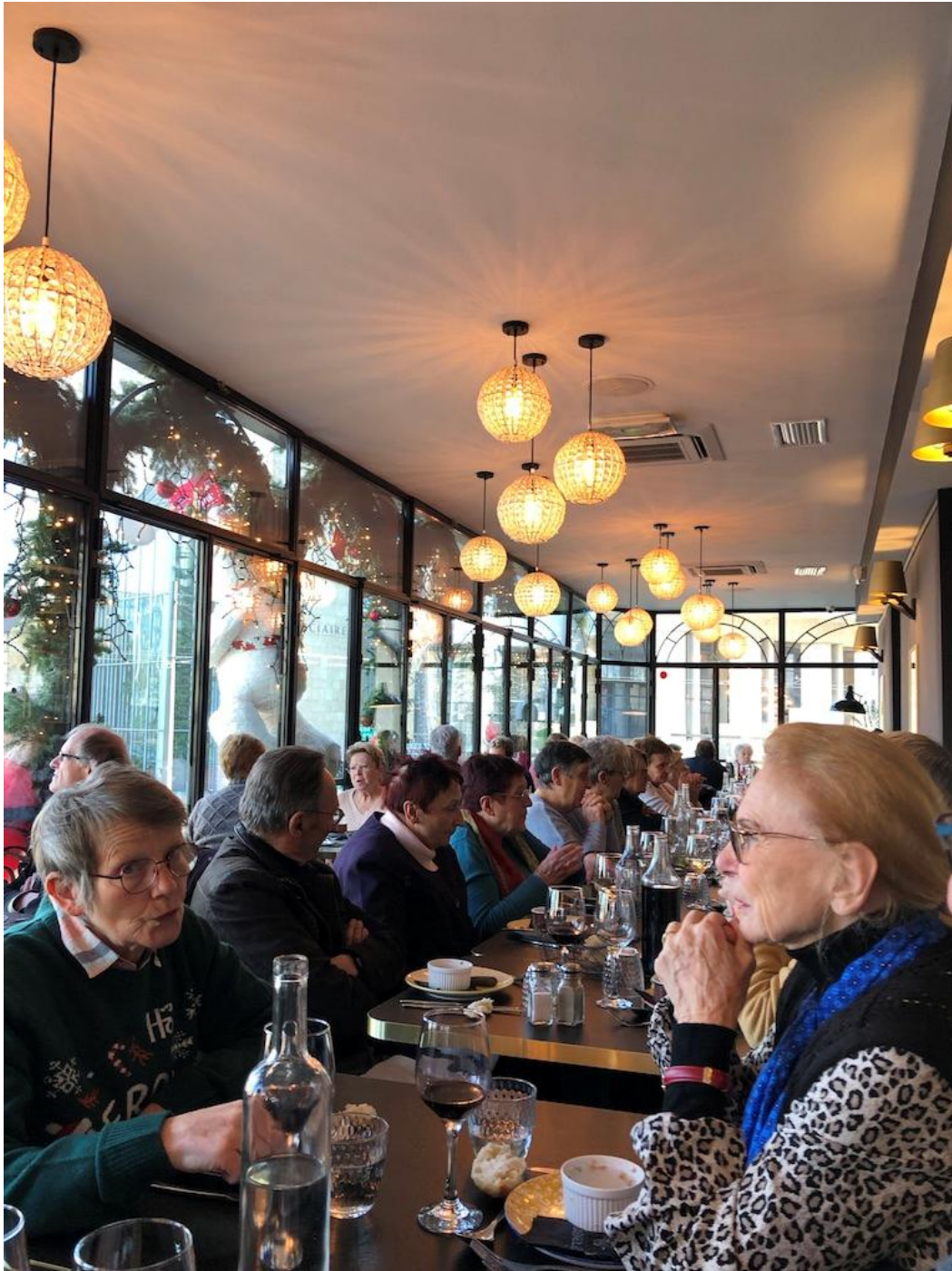
Au restaurant 1

Après le repas, l'après-midi fût consacrée à la visite des coulisses du circuit des 24 heures. Nos guides conférenciers passionnés et passionnants, nous ont fait entrer dans l'univers d'une des courses les plus mythiques au monde. Nous avons pu découvrir l'extraordinaire salle de presse pouvant accueillir jusqu'à 2500