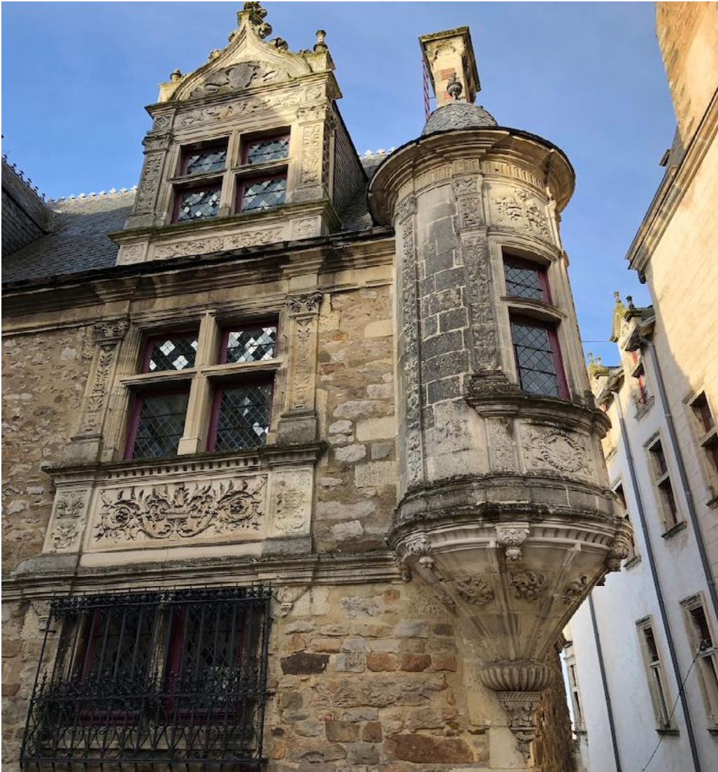
Hôtel particulier Renaissance