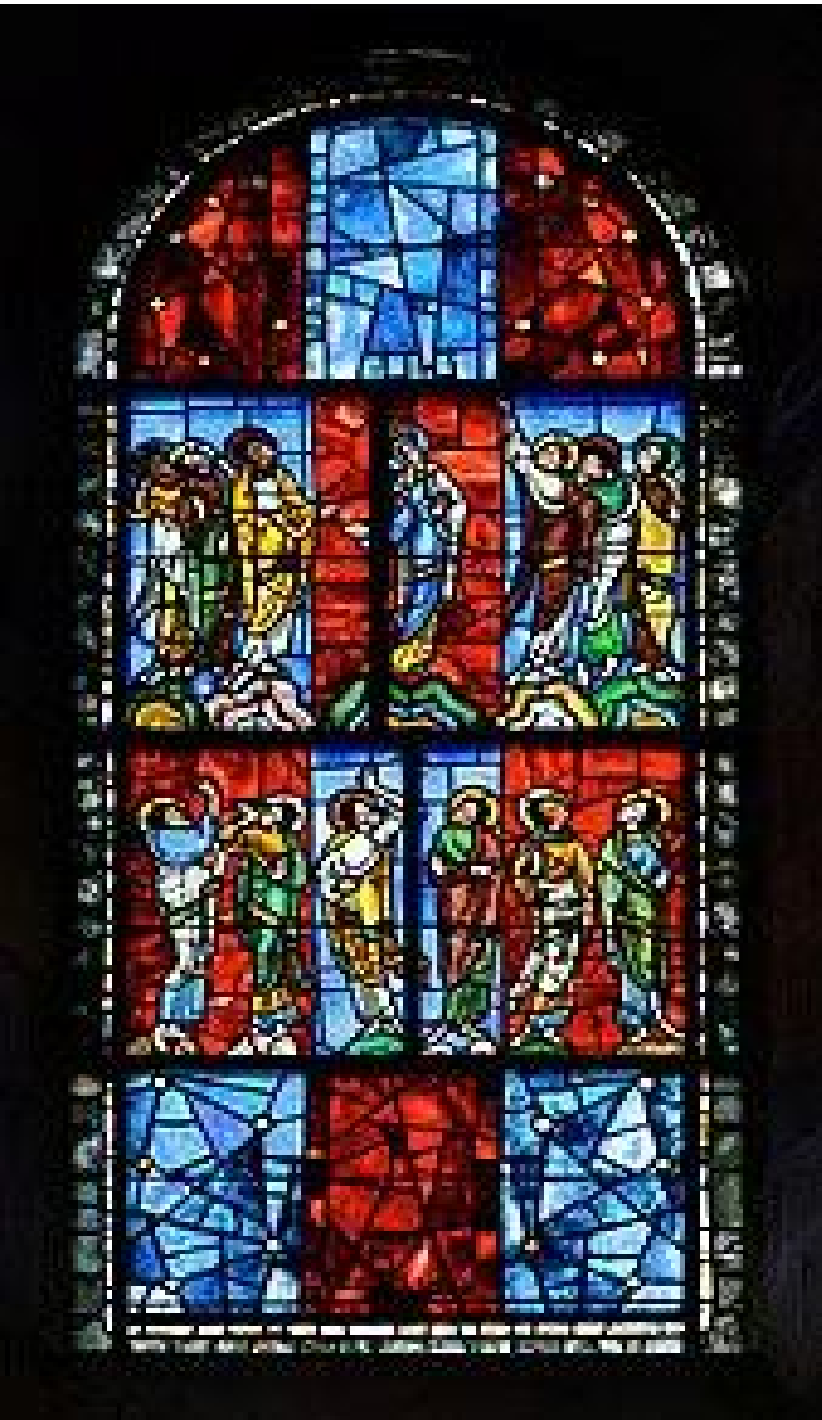
Le vitrail de l'Ascension 1