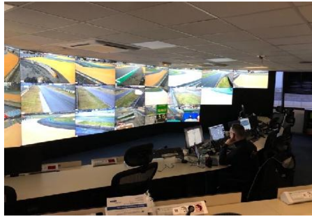
La salle de direction des courses